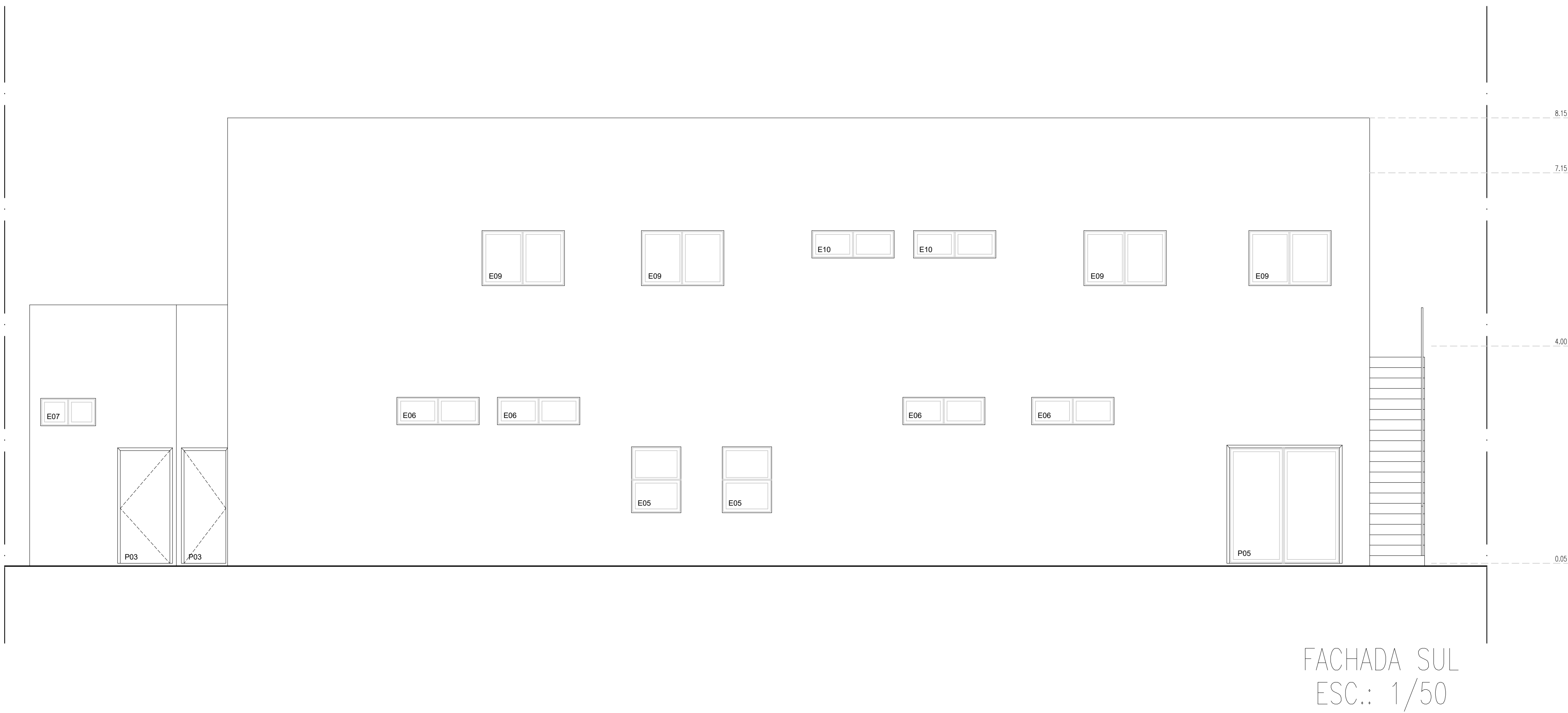
FACHADA SUL ESC.: 1/50